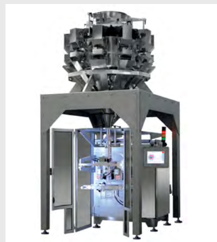
Solutions personnalisées avec peseuses intégrées, vis doseuses et volumétriques