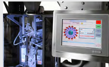
Ecran facile à utiliser